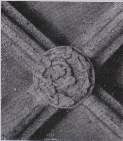
Abb. 59 Kreuzgang, Pförtnergang, Schlußstein (S. 132).

Fußwaschungsgang: 3. Joch (von Westen): 1. Fenster, Cam. Z, Taf. XIV ältester Typus mit einfachen Bandverschlingungen, der bogenförmige Abschluß ergänzt; 2. und 3. Fenster, Medaillons (Einfassung