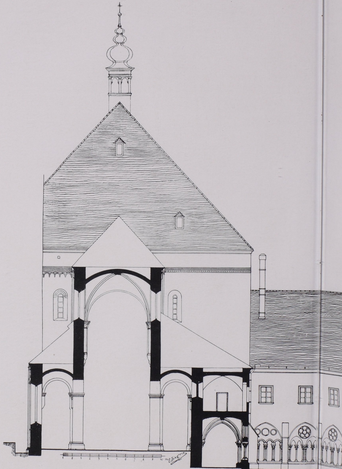
Abb. 4 Querschnitt durch das Langhaus der Kirche, den Kreuzgan