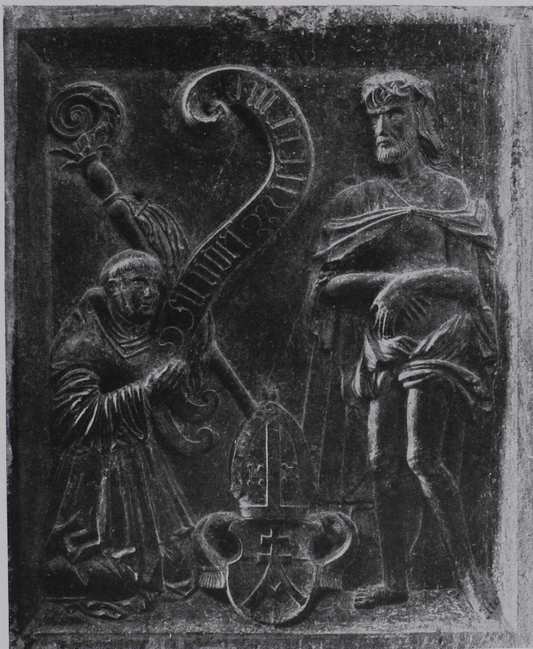
Abb. 266 Grabstein des Abtes Konrad II., Rückseite (n. 4) (S. 272).

Literatur: P. GEORG STROBL († 1717), Castrosolium Sanctae crucis Cenotaphicum . Mscr. im Stiftsarchiv, nach einem Chronogramm im Jahre 1688 abgefaßt; mit Abbildungen der Grabsteine in barocken Umrahmungen. (Vgl. S. 270.) — P. AMBROS SEINITZ († 1757), Mausoleum seu Cryptarium sanctae crucis . Mscr. im Stiftsarchiv. — MARQUARD HERRGOTT und RUSTENUS HEER, fortgesetzt von MARTIN GERBERT, Topographia principum Austriae . . quod est Monumentorum Augustinus Austriae tomus IV et ultimus 1772, cap. IV. Sepulcretum Abbatiae S. Crucis in Austria inferiori . Mit Stichen nach Aufnahmen von Salomon Klemer vom Jahre 1739. (Vgl. S. 37.) — M. KOLL, S. 38. Mit Angabe der ursprünglichen Lage der Grabsteine in der Kirche. — M. Z. K. XI (1866), S. XIX. (Grabstein Herzog Friedrichs II.) — M. Z. K. XVIII (1873), S. 46. (K. LIND, Über zwei Grabsteine im Kreuzgang.) — M. Z. K. N. F., I (1875), S. LVII. (K. LIND.) — M. Z. K. N. F., VIII (1882), S. CVIII. (Grabstein des Bischofs Nikolaus.) — B. u. M. d. A. V., XXIV (1887), S. 168. (K. LIND,