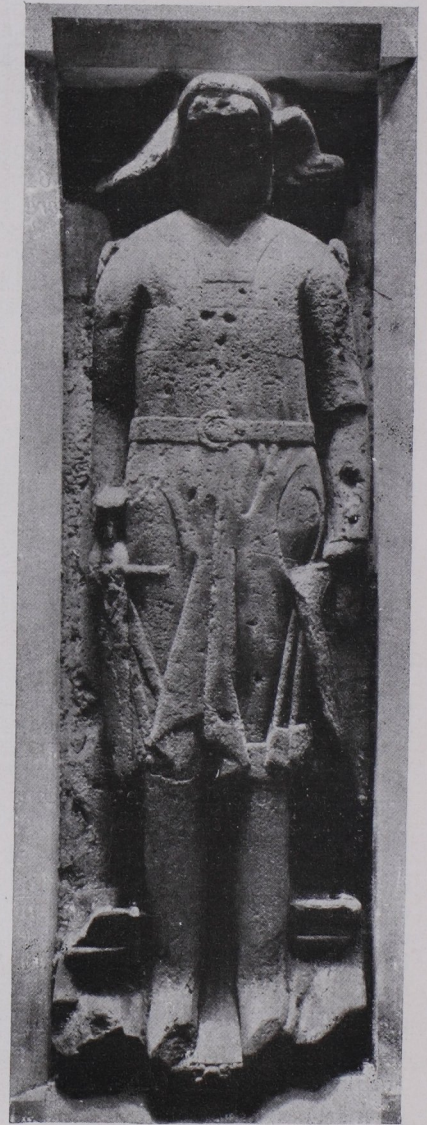
Abb. 269 Grabstein ohne Inschrift (Kreuzgang n. 14) (S. 274). / Abb. 270 Grabstein des Otto in Foro (Kreuzgang n. 8) (273). / Abb. 271 Grabstein des Herzogs Friedrich des Streitbaren (S. 275).

13. Sandsteinplatte, in der Mitte Kreuzstab mit kleeblattförmigen Endigungen, auf einem halben Vierpaß aufstehend. Umschrift: † III. KALEN. SEPTEMB. O. SIFRIDVS. LAEBLO . CIVIS. WINNENSIS (gest. nach 1289). 84 \times 198 cm. (Abb. in B. u. M. d. A. V., XXIX, Fig. 24.)