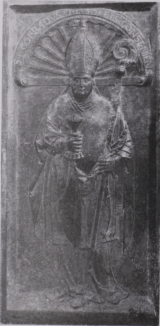
Abb. 267 Grabstein des Abtes Konrad II. (n. 4) (S. 272).

3. Inschrift: Mortis iter ad s. crucem in se suscipiens admodum reverendus dns Joannes Franciscus abbas Schlierbacensis monasterij sui XVII. annis propagator egregius sub hoc tumolo quiescit a laboribus obiit anno