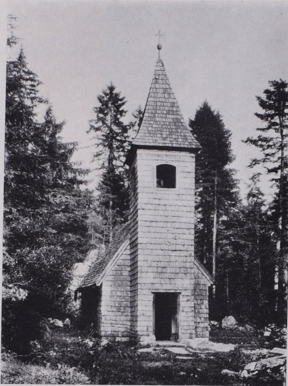
Abb. 242, 243