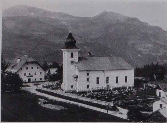
Abb. 238 St. Koloman, Pfarrkirche von SW. (S. 240).