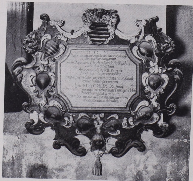
Abb. 224 Puch, Filialkirche, Totenschild der Dückher von Haslau, 1649 (S. 229).