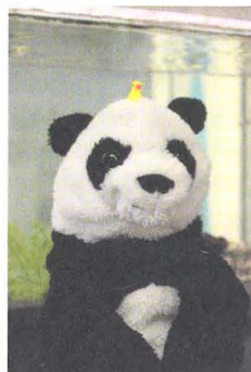
SEBASTIAN KLAUS PFUSTERER