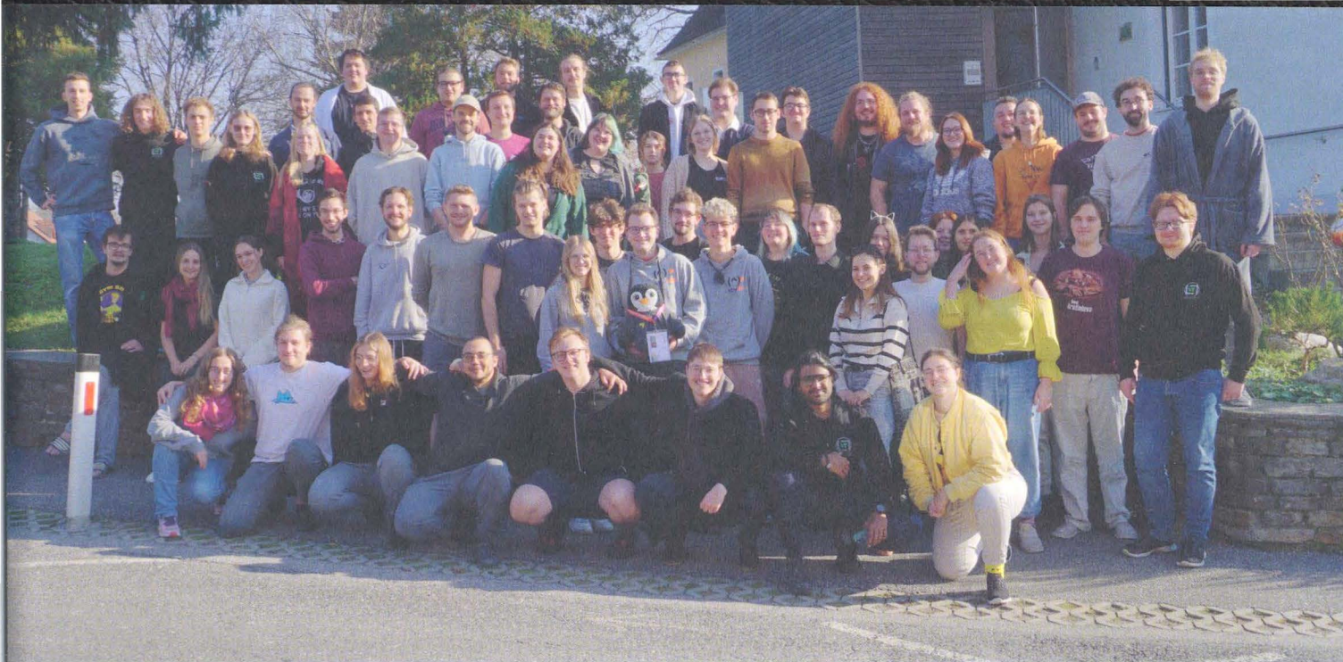
Gruppenbild vom HTU-Seminar 2024: © HTU Graz