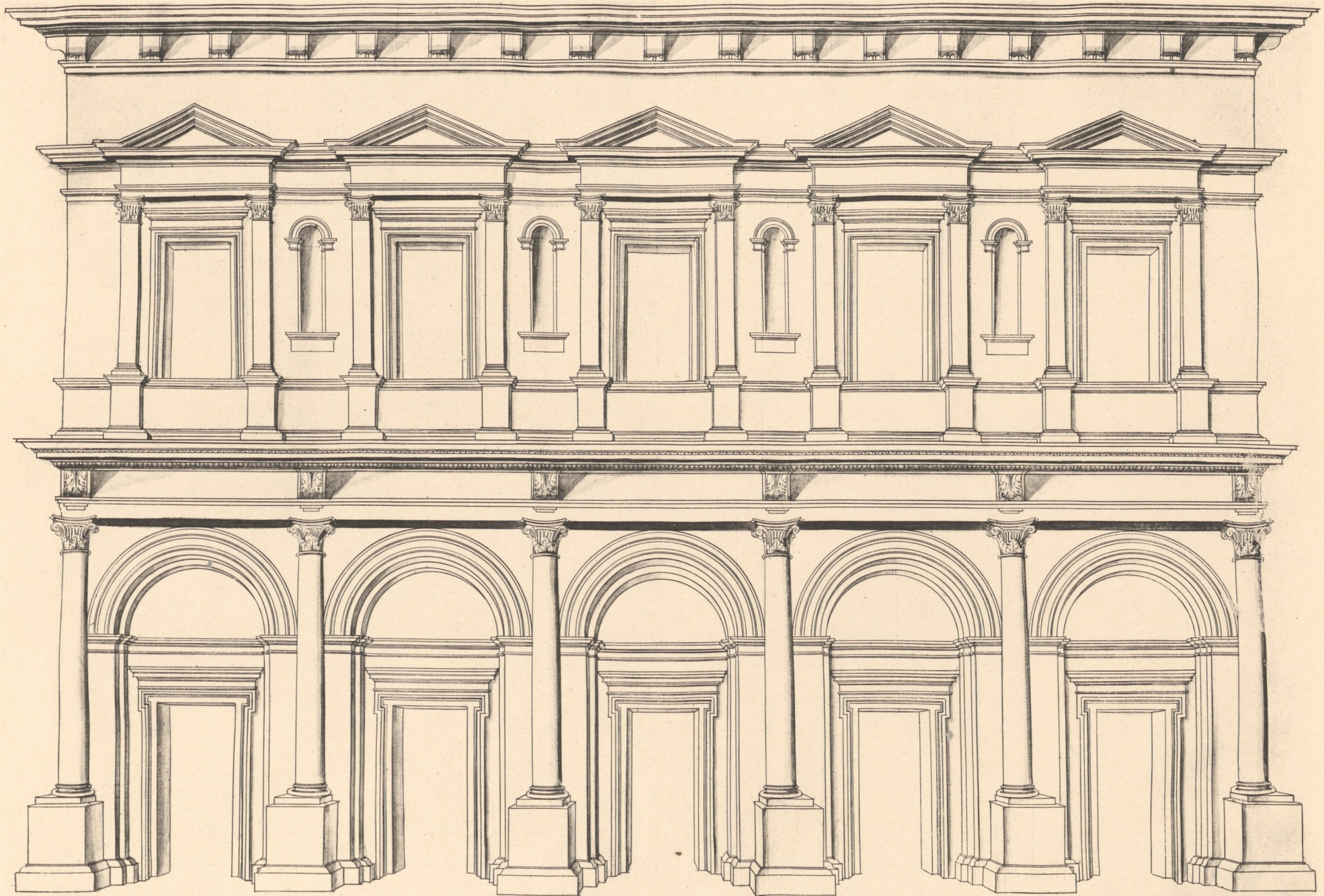
„Pour une corps de Logis selon Lantique“.