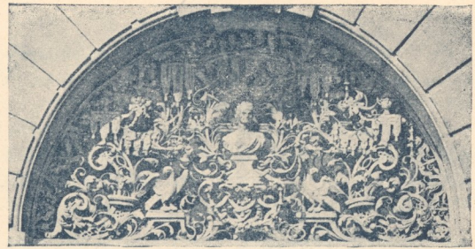
Abb. 253. Oberlichtgitter am Palais Trautson, 1720–30, Architekt Fischer von Erlach.

C-Schnörkeln aus über die hohe Kante gebogenem breitem Bandedeisen mit Rand besetzt, die Mitte mit gestanzter 4teiliger Blattrosette gefüllt. Die Kreuzungen sind mit größeren, die Stabmitten mit kleineren Rosetten besetzt; eine klare und trotz der Einfachheit des Motivs recht wirkungsvolle Arbeit.