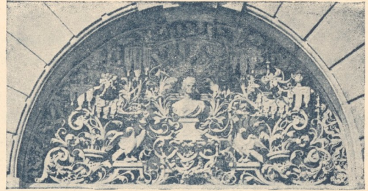
Abb. 253. Oberlichtgitter am Palais Trautson, 1720–30, Architekt Fischer von Erlach.

C-Schnörkeln aus über die hohe Kante gebogenem breitem Bandedeisen mit Rand besetzt, die Mitte mit gestanzter 4teiliger Blattrosette gefüllt. Die Kreuzungen sind mit größeren, die Stabmitten mit kleineren Rosetten besetzt; eine klare und trotz der Einfachheit des Motivs recht wirkungsvolle Arbeit.