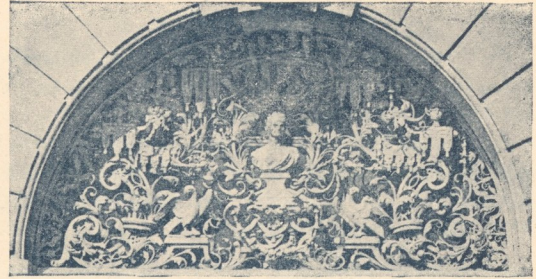
Abb. 253. Oberlichtgitter am Palais Trautson, 1720–30, Architekt Fischer von Erlach.

C-Schnörkeln aus über die hohe Kante gebogenem breitem Bandedeisen mit Rand besetzt, die Mitte mit gestanzter 4teiliger Blattrosette gefüllt. Die Kreuzungen sind mit größeren, die Stabmitten mit kleineren Rosetten besetzt; eine klare und trotz der Einfachheit des Motivs recht wirkungsvolle Arbeit.