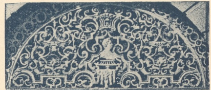
Abb. 254. Oberlichtgitter am Palais Trautson.