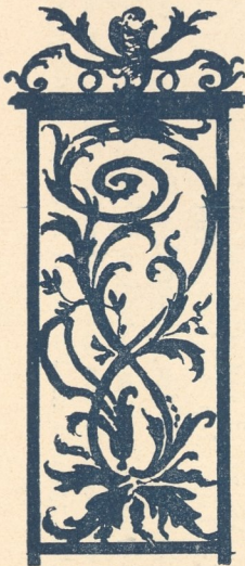
Abb. 226 u. 227.