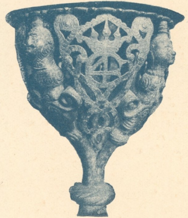
Abb. 194. Geschmiedeter Taufkesselkorb aus der Holmenskirche in Kopenhagen.

Unsere Abb. 198 zeigt das großartige, bei beiden Toren gleiche Mittelfeld des Obertheils, das von demselben doppelten Rosetten- und Kreisfries umrahmt ist, wie die Felder der Flügel. Diese sind bei den beiden Türen verschieden, während die Mittelstücke wieder gleich sind. Vermutlich sind aber die Abweichungen in den Feldern der zweiten Tür (statt