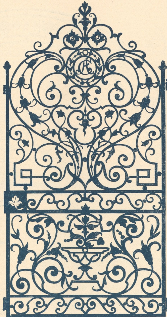
Abb. 159. Gittertür, 1711.