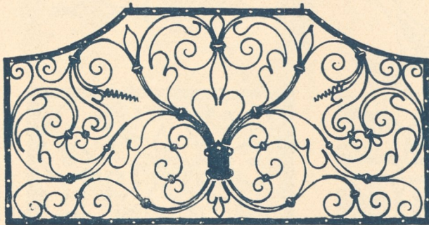
Abb. 157. Abschluß einer Nische, 17. Jahrh. (Berl. Kunstgew.-Museum).