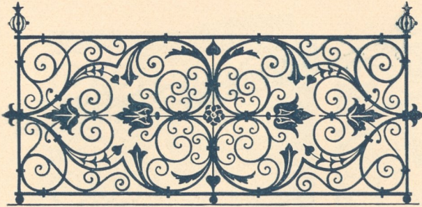
Abb. 156. Ba'kongitter am Markusplatz, 16. Jahrh.