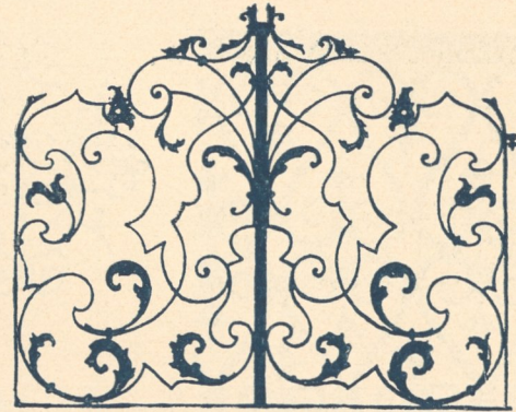
Abb. 160. Gittertürchen, 18. Jahrhundert.