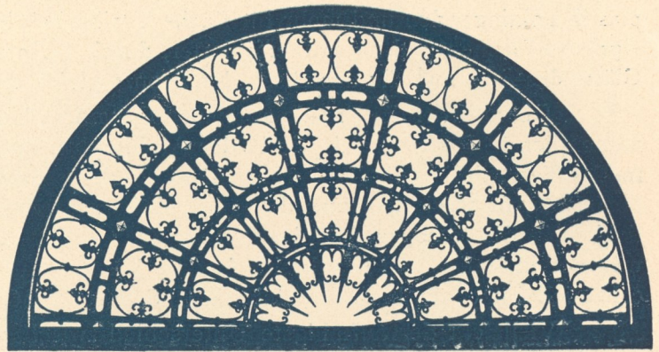
Abb. 144. Oberlichtgitter, Via della Spada, Florenz.

Wo die Stabfelder von Friesen umrahmt sind, ist der obere Abschluß meist durch eine Zackenborte aus Schnörkeln gebildet; doch finden sich auch dabei aufgesetzte Lanzenspitzen, die bei nach oben durchgehenden Stäben später allgemein üblich wurden.