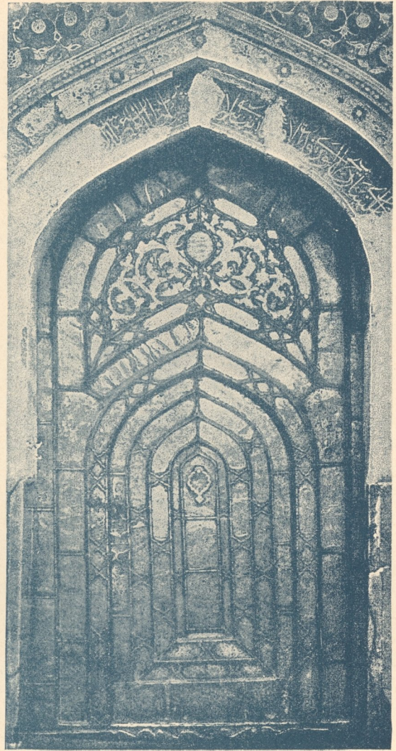
Abb. 118. Silberne Tür in der Moschee des Schech Safi in Ardebil. (Aus Sarre's Denkmäler persischer Baukunst.)