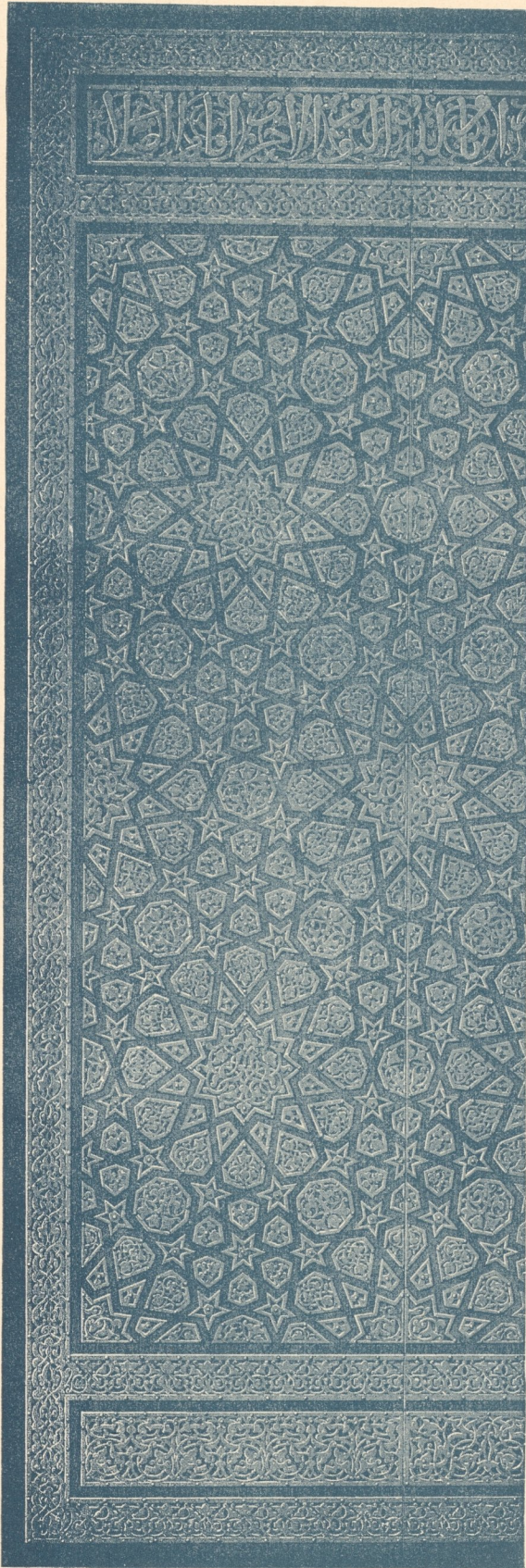
Abb. 117. Tür der Moschee Sidi Jussuf el Maz in Kairo, Anfang 15. Jahrh.