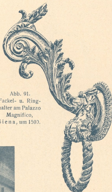
Abb. 91. Fackel- u. Ring- halter am Palazzo Magnifico, S i e n a, um 1500.