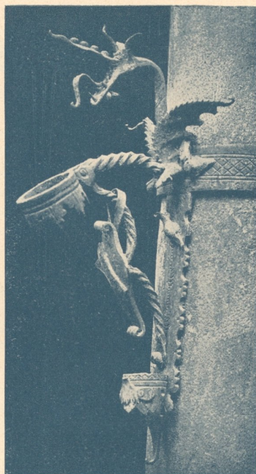
Abb. 90. Fackelhalter an der Postierla-Säule, S i e n a, 1487.

Pferdehaltern, von denen einige, in Florenz am Palazzo Vecchio und am Bargello, noch dem 13. Jahrh. angehören. Diese sind das Vollendetste, was die toskanische Schmiedekunst hervorgebracht hat.*)