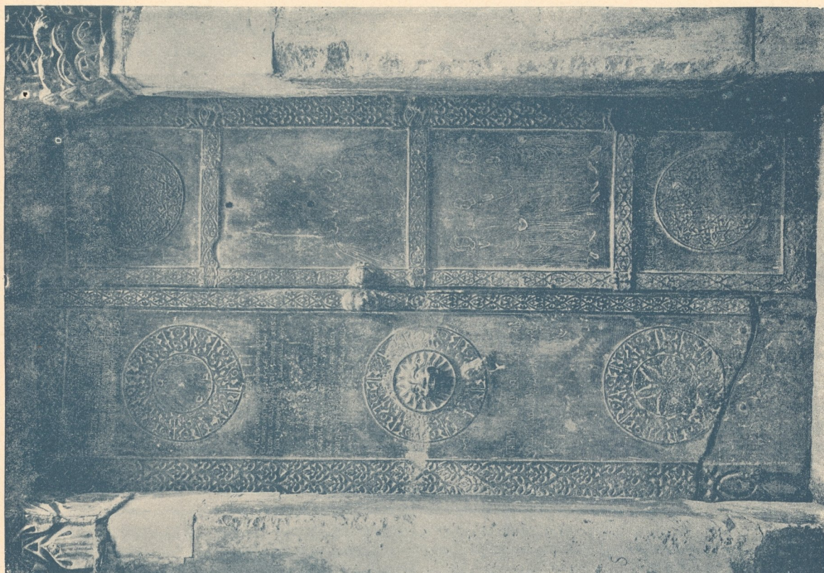
Abb. 31 2 . Tür der Grabkapelle des Bohemund in Canosa. (Meister Roger aus Amalfi.)