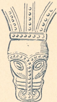
Abb. 17. Löwenkopf aus Bronze.

Ländern war das Gießen und Schmieden der Bronze, wie selbst die ältesten skandinavischen Bronzewaffen beweisen, schon früh geübt, und die reichen Schätze der nordischen Museen (Kiel, Kopenhagen usw.) zeigen uns die künstlerische Verarbeitung der Bronze in reichster Technik, insbesondere in schön gepunzter Arbeit, auch in Verbindung mit Eisen (mit Bronze belegte eiserne Schildbuckel, Helme usw.) weit vor dem Beginn der christlichen Zeitrechnung. Die Niellotechnik z. B. ist schon um 1000 v. Chr. ausgiebig angewandt worden, später lange Zeit wieder zurückgetreten, als durch etruskische Einfuhr die plastische Verzierung zunahm, und zur Zeit der Völkerwanderung von neuem in Aufnahme gekommen. Zu dieser Zeit haben die Germanen die Bronze gegossen, getrieben, ziseliert, verzinnt, versilbert und vergoldet, und mit Steinen und Schmelz, mit Tauschierung und Silberfiligran geschmückt.