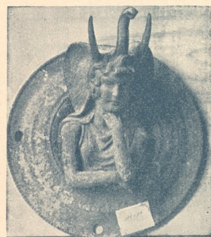
Abb. 11. Aus dem Nationalmuseum in Neapel.

Sie zeigt dieselbe Feldereinteilung, wie die Tür des Pantheons, nur daß die unteren großen Felder nicht schlanker, sondern ebenso groß sind, wie die oberen. Wie bei jener haben die großen Felder doppelte, die kleinen quergestellten einfache Umrahmung, und ihre Ränder sind mit den gleichen Perlstäben wie bei der Tür des Heroons (Abb. 6) eingefast. Die großen Füllungen sowie die untersten und oberen kleinen tragen gebuckelte Rosetten (die der oberen gedrehte) in reicher Anordnung und dazwischen Kreise mit sonderbaren kelchartigen Gebilden (römische Christenkirche des Arkadius, 400 n. Chr.?) *) , während die mittleren Querfüllungen mit arabischen Schriftzeichen bedeckt sind. Auch ein paar große Knöpfe, deren Entstehungszeit schwer zu bestimmen ist, sitzen noch nahe beieinander auf dem einen unteren Felde, einer auf der Mitte der inneren Umrahmung, zwei andere unmotiviert auf dem Rosettenornament, so daß man sieht, sie sind später hierhergesetzt. Die großen Felder sind zwischen den ornamentierten Blechen aus zahlreichen kleinen glatten Blechen zusammengesetzt, die mit übergelegten (gefalteten?) Rändern mit kleinen Nägeln unregelmäßig genagelt sind.