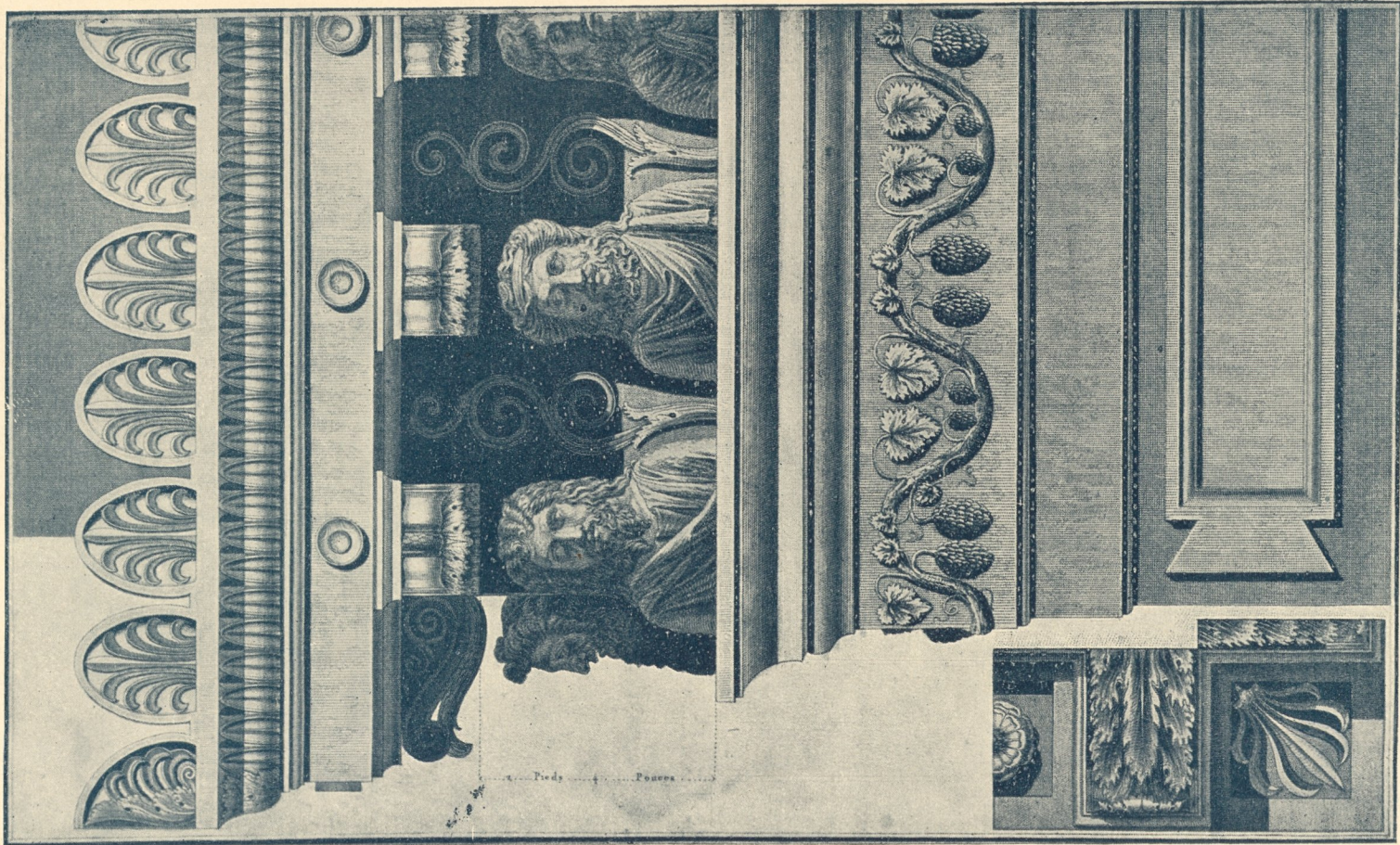
Fig. 145. Hauptgesimse von einem Totenturm (n. Cassas Bd. I, No. 135).