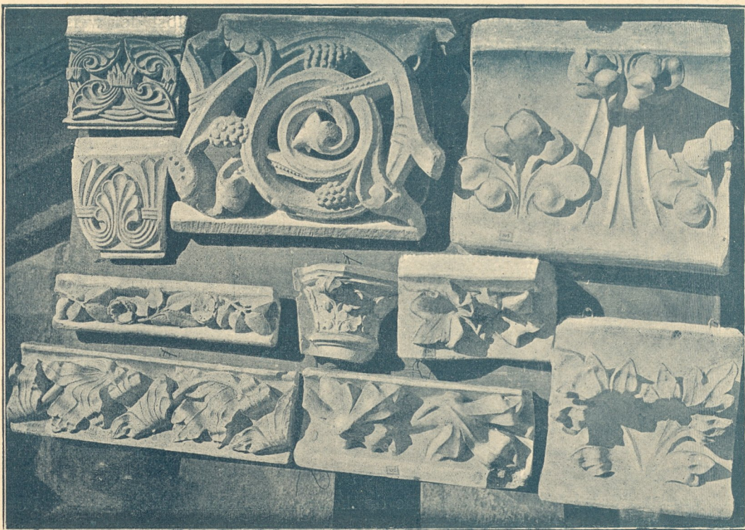
Fig. 345. Gotische Ornamentierung.