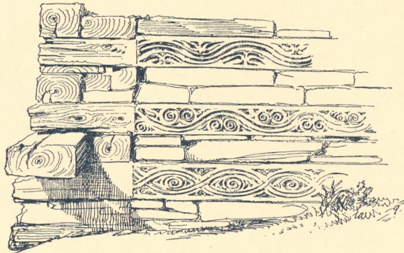
Fig. 459. Ornamentierung einer Mauer am Tempel zu Jacko.

Holz und Stein sind gemeinsam zum Bau benutzt. Die Unterbauten der Tempel zeigen eine zwischen Steinlagen mehr oder weniger regelmässige Schichtung von rechtwinklig bearbeiteten Hölzern, die auf den Ecken ohne festere Fügung aufeinander liegen. Fig. 458.