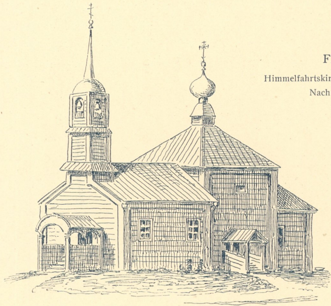
Fig. 379. Himmelfahrtskirche im Dorfe Wojalin. Nach Golyscheff.

Auch die Dachflächen sind nicht in Schindeln ausgeführt, sondern mit groben Brettern wie unsere provisorischen Jahrmarktbuden notdürftig überdeckt.