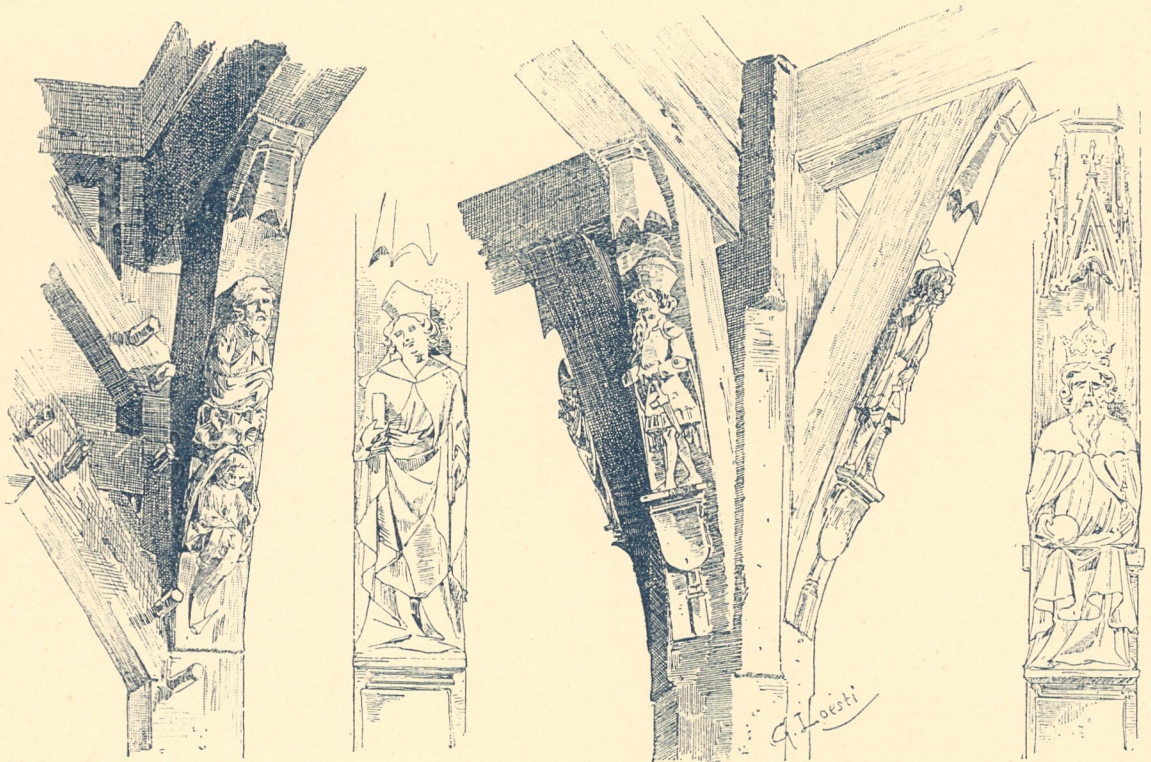
Fig. 327. Altes Rathaus zu Esslingen.