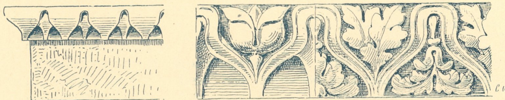
Fig. 163. Römischer Blätterstab oder Karnies.