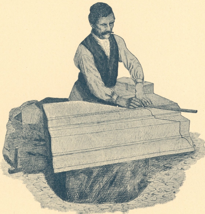
Fig. 105. Aufzeichnen der Ecke.