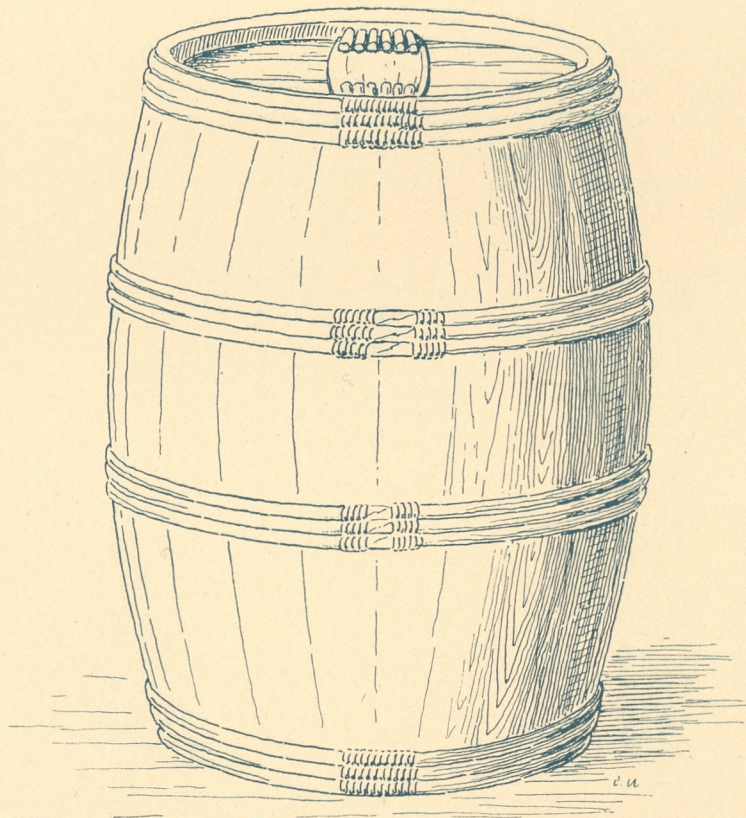
Fig. 48. Fertiges Fass.