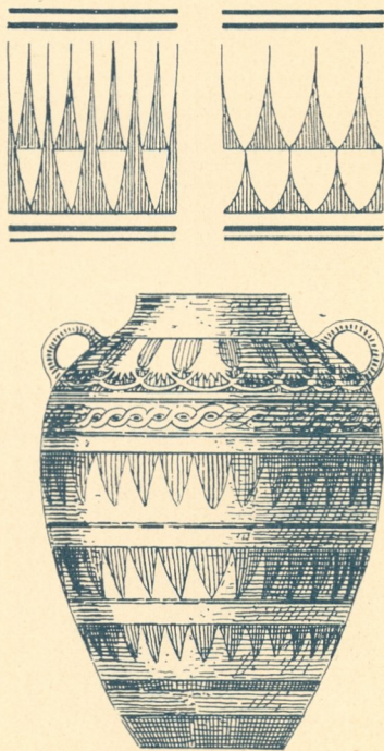
Fig. 28. Griechisches Gefäss.

Der ganze Gedankengang der Ausschmückung der Gefässe schliesst sich dem der Kleidung an, nur die Formen werden durch die Uebertragung in ein anderes Material etwas stumpfer, regelmässiger und einfacher. Die grosse Zahl dieser Formen, wie Rankenverschlingungen und Spiralen mit Palmetten, Lotosblumen und Knospen, Fig. 32, ebenso die naturalistische Wiedergabe von Kränzen und Zweigen ausführlicher zu besprechen, gehört nicht unserem Thema zu, sondern in die Entwicklung der Ornamentik.