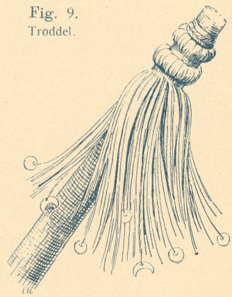
Fig. 9. Troddel.

Menschen benutzt werden, so finden wir sie in besonders charakteristischer Anwendung auch bei der Aufzäumung der Tiere (Esel, Kamele, Elefanten) wieder, wovon Fig. 10 u. 11 interessante Beispiele geben.