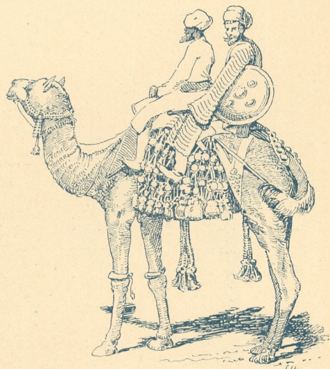
Fig. 11. Indische Aufzäumung eines Kamels.