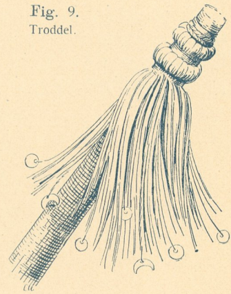
Fig. 9. Troddel.

Menschen benutzt werden, so finden wir sie in besonders charakteristischer Anwendung auch bei der Aufzäumung der Tiere (Esel, Kamele, Elefanten) wieder, wovon Fig. 10 u. 11 interessante Beispiele geben.