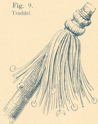
Fig. 9. Troddel.

Menschen benutzt werden, so finden wir sie in besonders charakteristischer Anwendung auch bei der Aufzäumung der Tiere (Esel, Kamele, Elefanten) wieder, wovon Fig. 10 u. 11 interessante Beispiele geben.