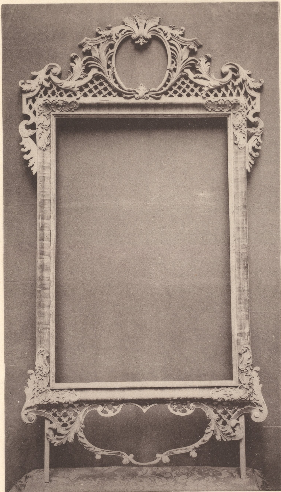
Geschnitzter barocker Rahmen.