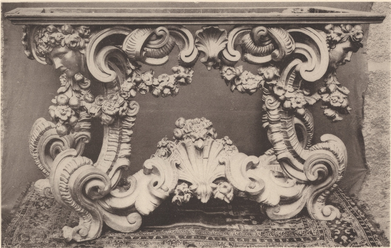
Lichtdruck von Jos. Albert, München.