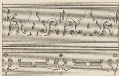
Grundriss 1/2 der Ansicht.