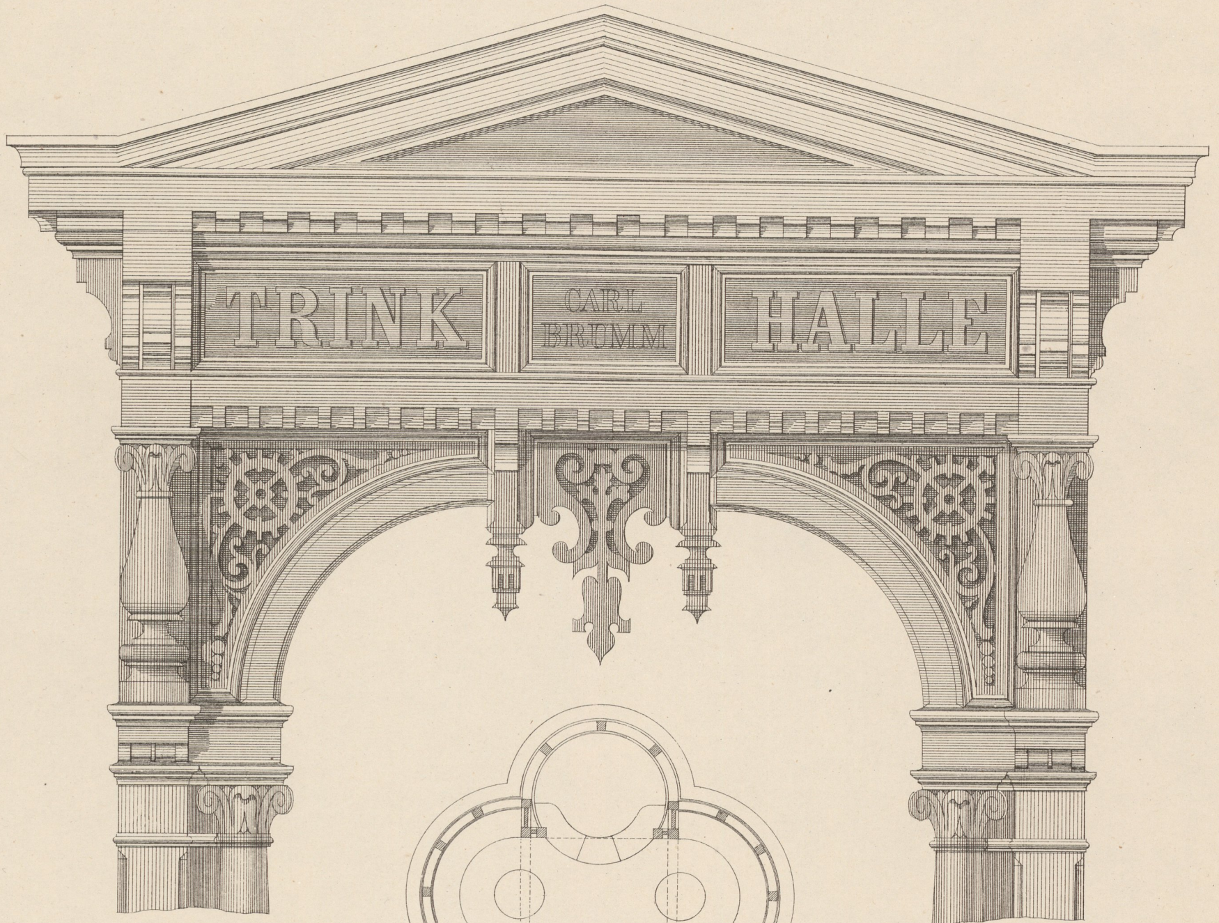
0,1 natürlicher Grösse.