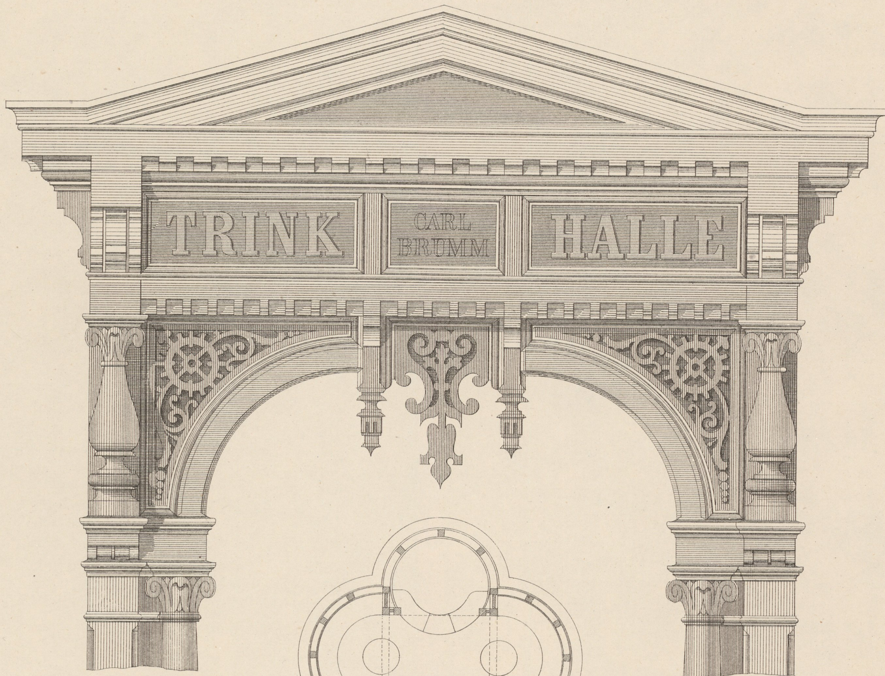
0,1 natürlicher Grösse.