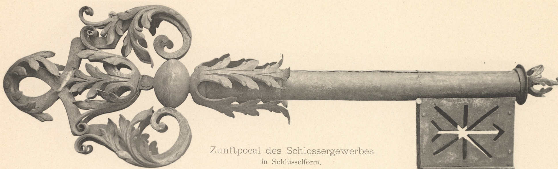
Zunftpocal des Schlossergewerbes in Schlüsselform. 18. Jahrhundert. — Aus Nürnberg. Germanisches Museum in Nürnberg.