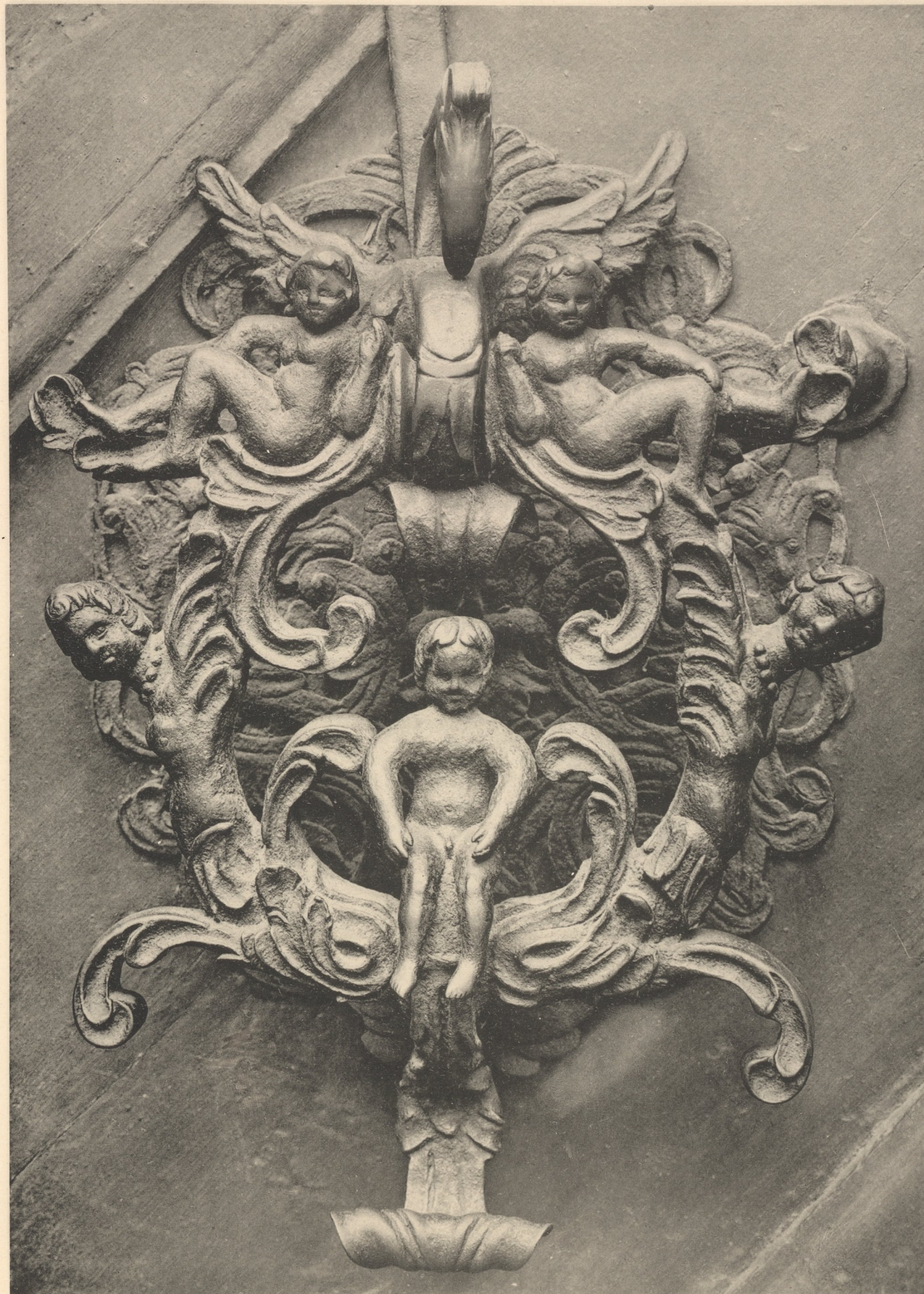
Schmiedeeiserner Thürklopfer vom alten Zeughaus in Nürnberg, Pfannenschmiedgasse 24. Anfang des 17. Jahrhunderts. Bayerisches Nationalmuseum in München.