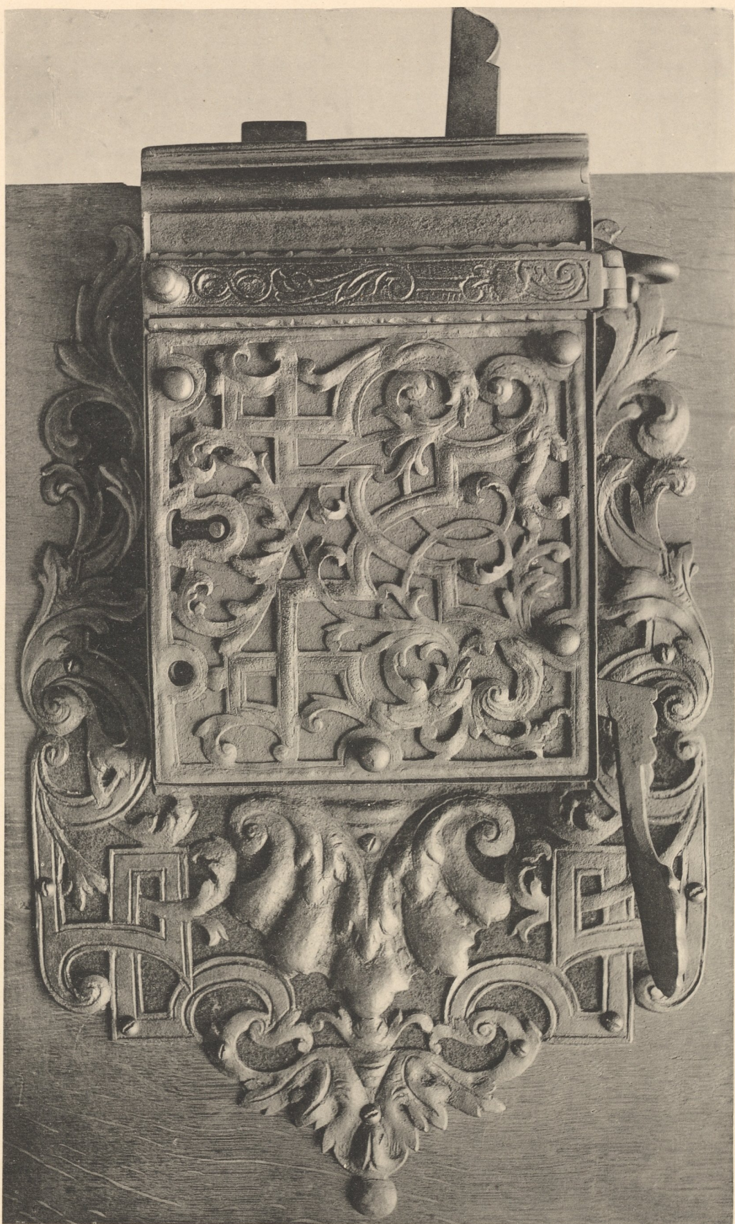
Eisernes Thüschloss mit getriebenem oder durchbrochenem Schlossbelege und ebensolcher Unterlage. 18. Jahrhundert. Germanisches Museum in Nürnberg.