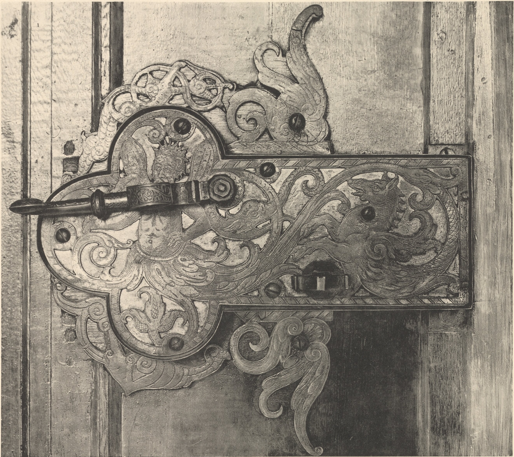
Lichtdruck von Jos. Albert, München.