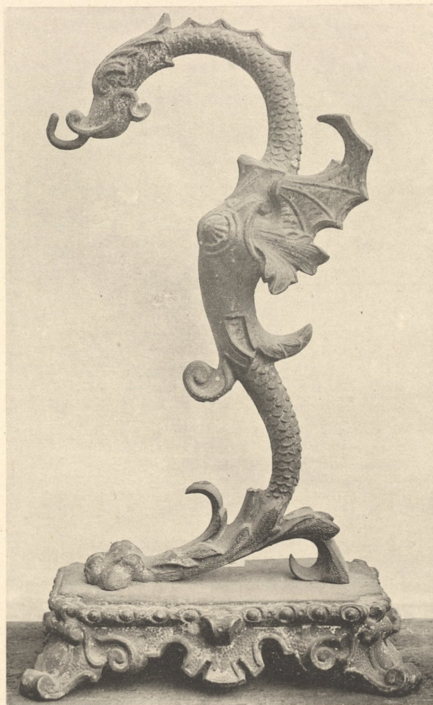
Lampenträger, italienisch. 16. Jahrhundert.