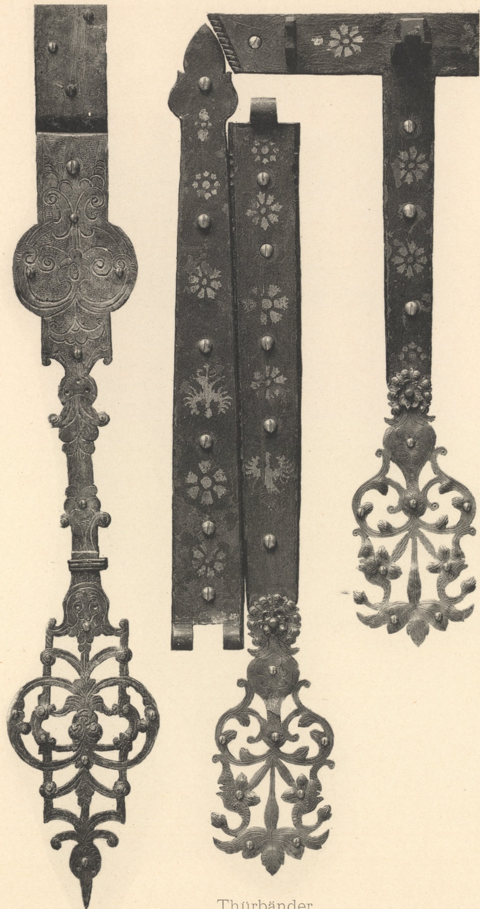
Thürbänder Um 1600.