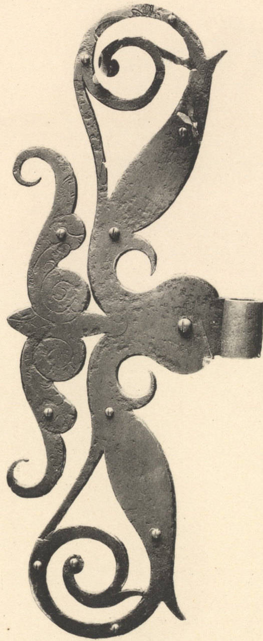
Thürband 2. Hälfte des 17. Jahrh. Bayer. Gewerbemuseum in Nürnberg.