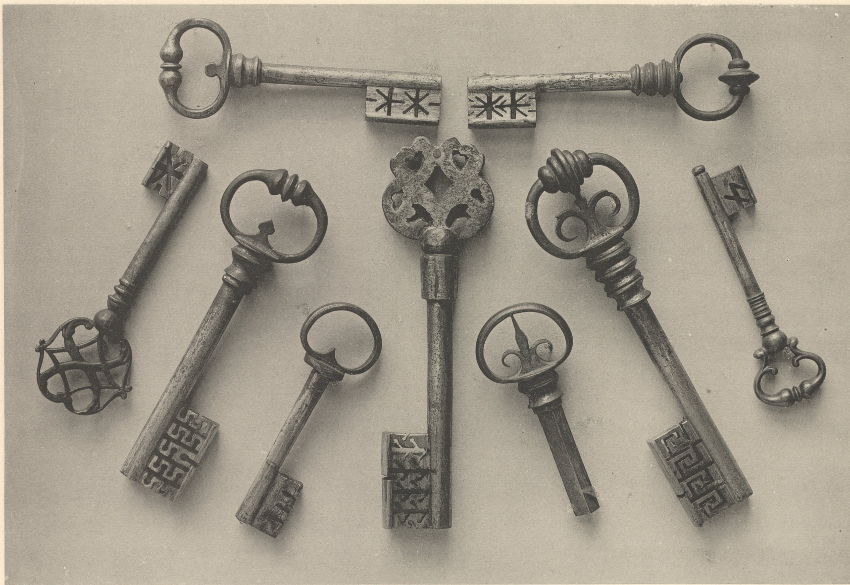
Schlüssel. 16. und 17. Jahrhundert. Gewerbemuseum in Nürnberg.