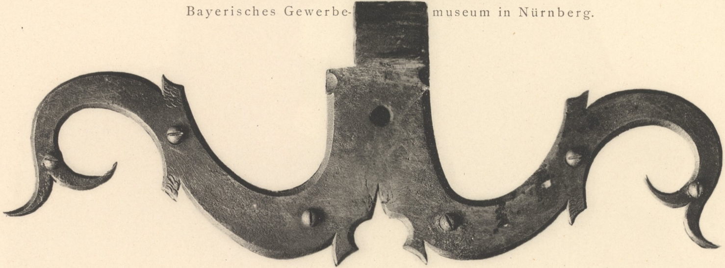
Thürband um's 16. Jahrhundert. Bayerisches Gewerbemuseum in Nürnberg.