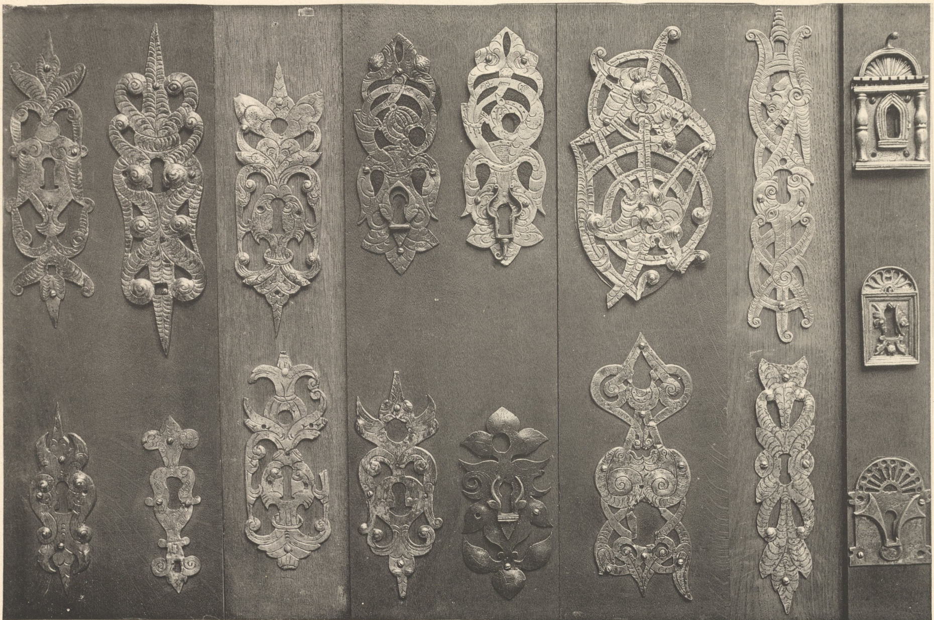
Lichtdruck von Jos. Albert. München.