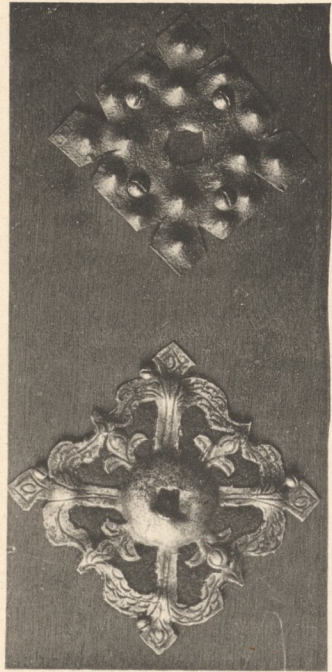
Unterlagsplatte für Thüringe, Zugknöpfe etc. 16. u. 17. Jahrh.