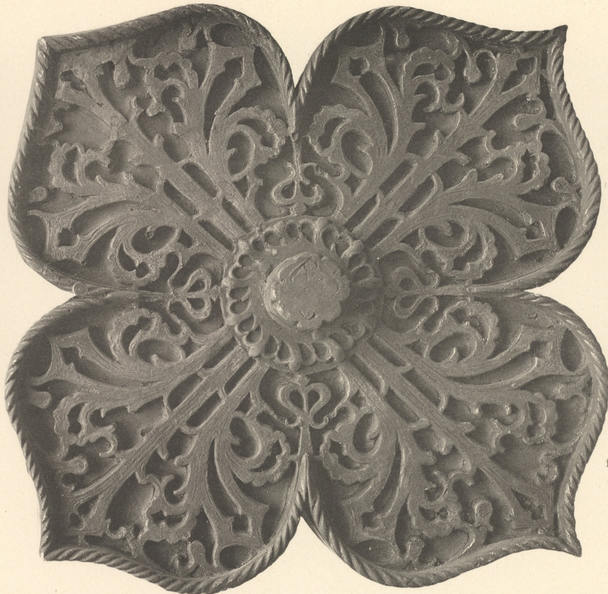
Durchbrochene Unterlagsplatte eines gothischen Thürklopfers. 15. Jahrh.