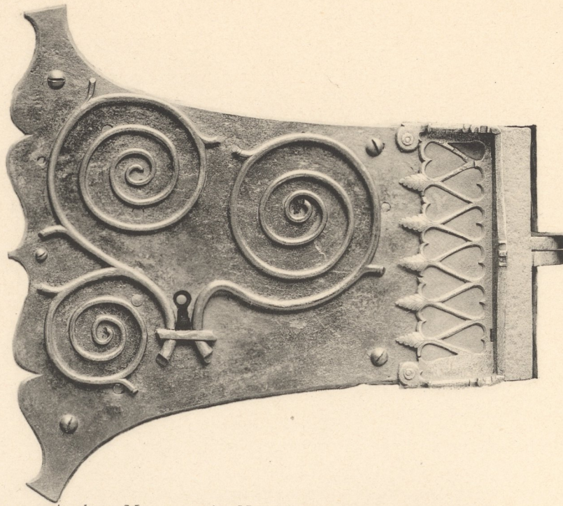
Gothische Thürschlösser. 15.—16. Jahrhundert. — Germanisches Museum in Nürnberg.