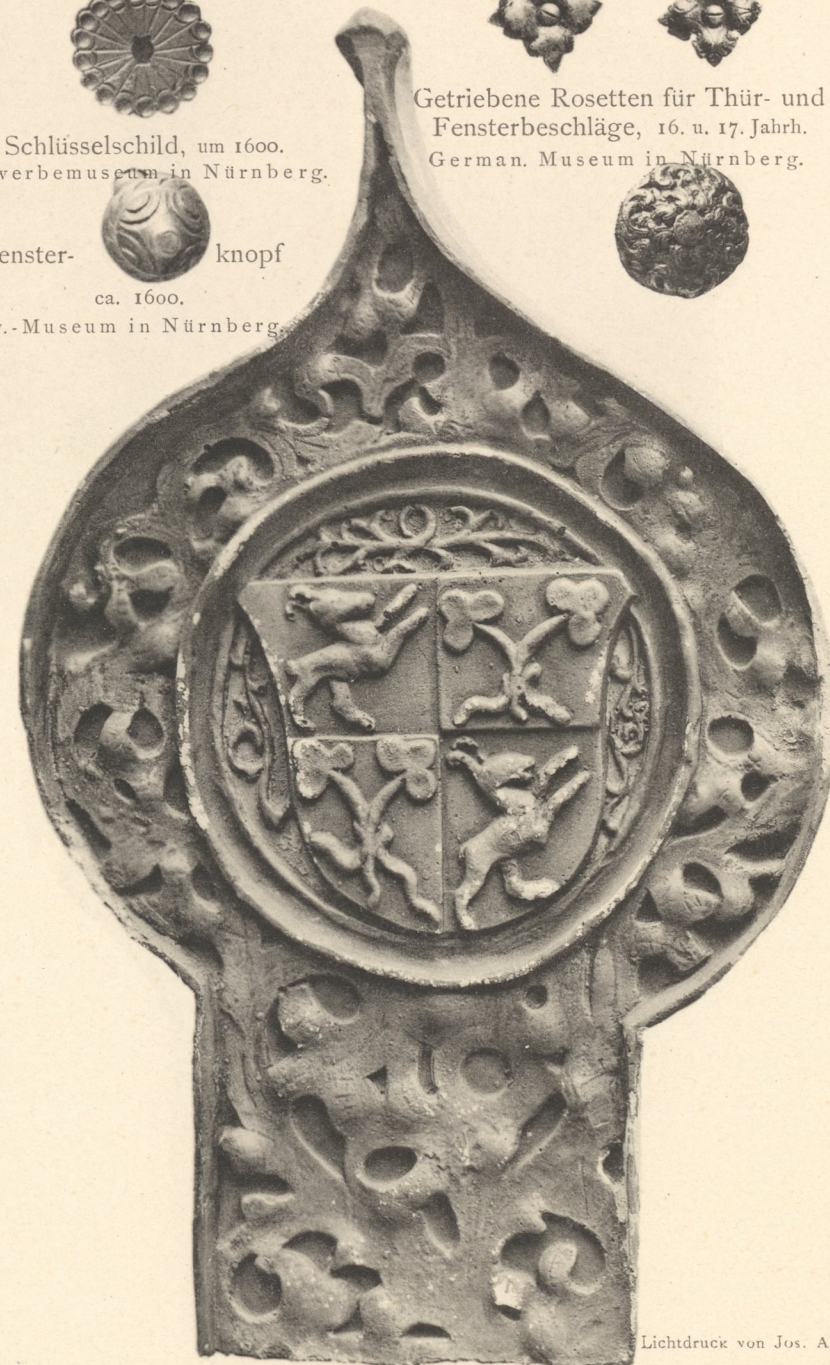
Gothische, durchbrochene, mit Wappen gezierte Unterlagsplatte. 15. Jahrh. German. Museum in Nürnberg.