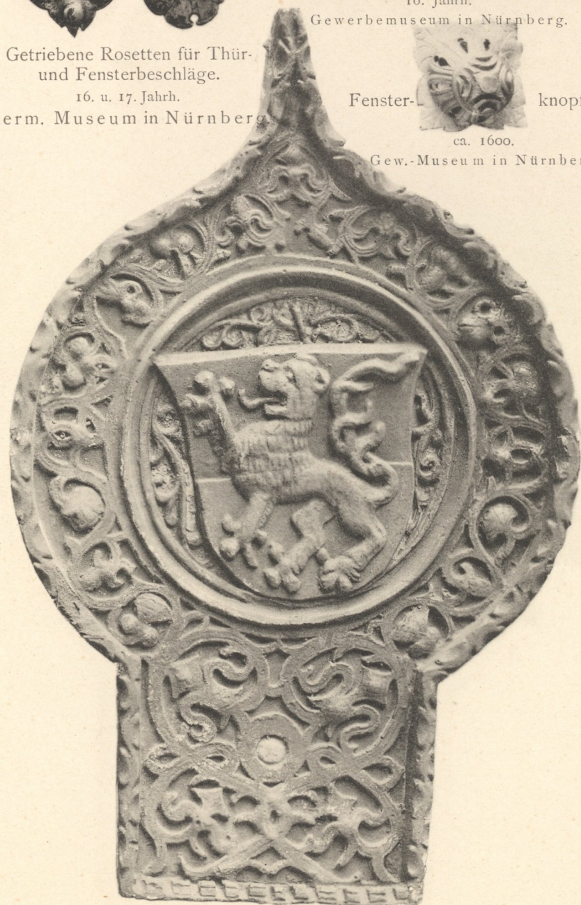
Gothische, durchbrochene, mit Wappen gezierte Unterlagsplatte. 15. Jahrh. German. Museum in Nürnberg.